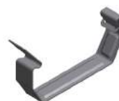
Art. 732005 Rvs kabelklem groot voor side profiel