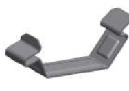
Art. 732003 Rvs kabelklem groot voor insert profiel