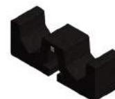
Art. 729625 Rubber tegeldrager geschikt voor kabelgoot bij ValkPro+*