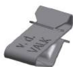
Art. 732001 Rvs kabelklem klein